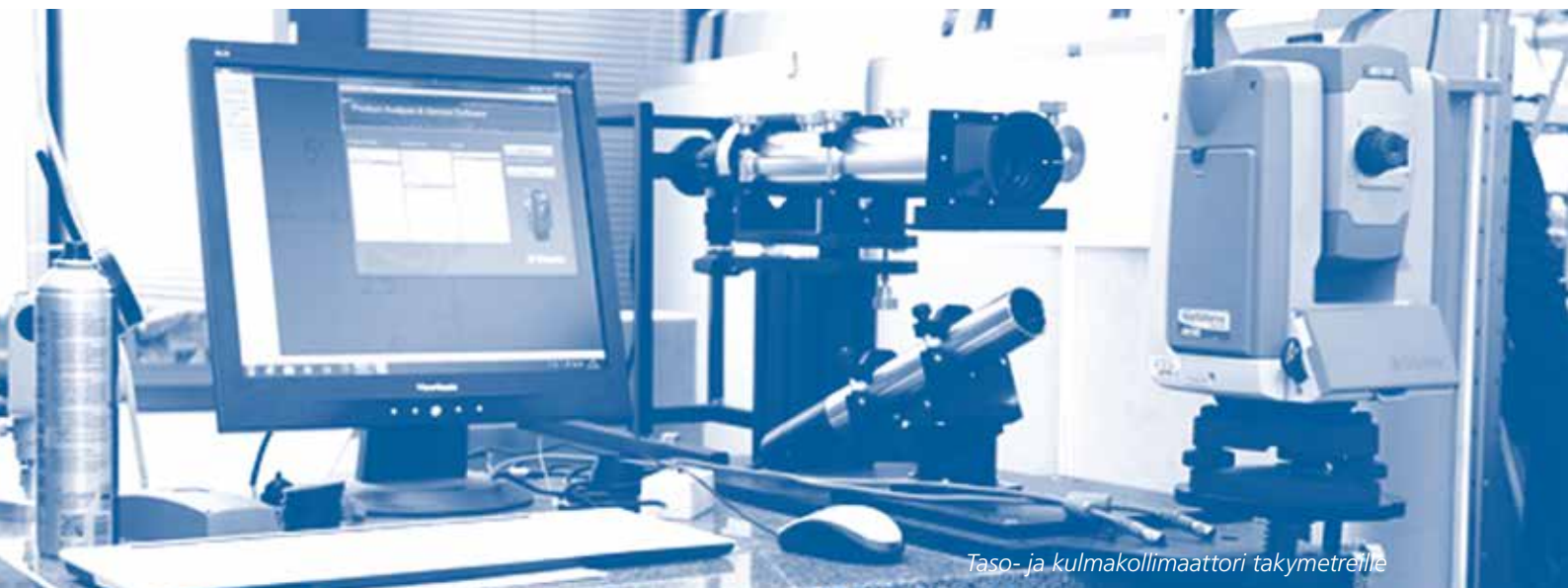
Taso- ja kulmakollimaattori takymetrille